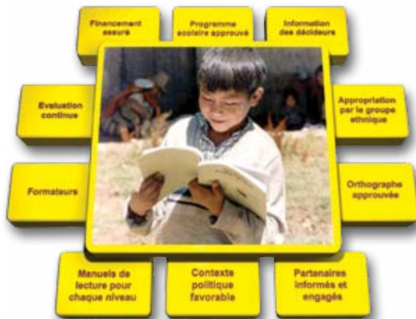
Schéma conçu par Susan E. Malone, doctorat en sciences de l'éducation

Composantes d'un programme d'éducation multilingue durable