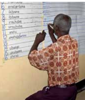
Los participantes en el taller usan su conocimiento del idioma en ejercicios de análisis.

El desarrollo de la ortografía para los hablantes del idioma kuy de Camboya tiene que vencer los desafíos de un inventario fonémico amplio, la compleja escritura jemer y el hecho de que pocos hablantes del kuy tienen una habilidad adecuada en la lectura de ese alfabeto. A pesar de esas complicaciones, la contribución y la participación de la comunidad en el proceso han sido significativas. Reuniones de concienciación del idioma, un taller de ortografía y un comité lingüístico forman una buena base para que los hablantes del idioma kuy adopten su nuevo sistema de escritura.