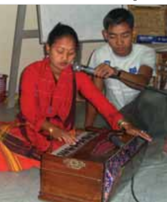
El armonio es un instrumento popular en Bangladesh.