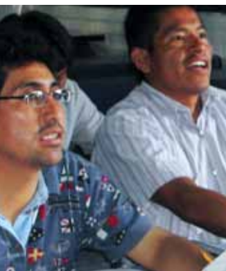
Todos los días los estudiantes y los maestros aprenden algo nuevo.

GUATEMALA —Niños de Guatemala ven un vídeo en ixil “Mi idioma del corazón”, escrito y filmado por un equipo ixil. Fue preparado para enseñar a los ixiles a leer en su idioma. Este equipo local ahora escribe, filma y edita sus propios vídeos, y sus miembros están dispuestos a ayudar a otros a hacer lo mismo.